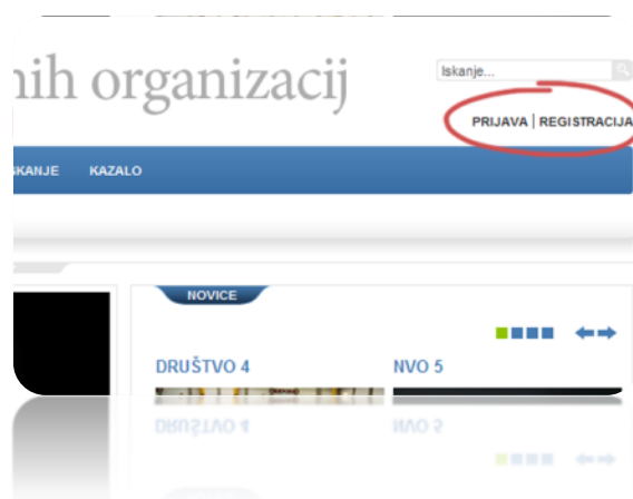
Slika 1: Prijava | Registracija

Registracijski postopek lahko opravite na vsaki strani in podstrani portala MINVO. Najlažje boste opravili postopek registracije tako, da boste na naslovni strani portala (spletni naslov: http://www.minvo.si ) našli v zgornjem desnem kotu alinejo oziroma tekst PRIJAVA | REGISTRACIJA , kot prikazuje naslednja slika 1.