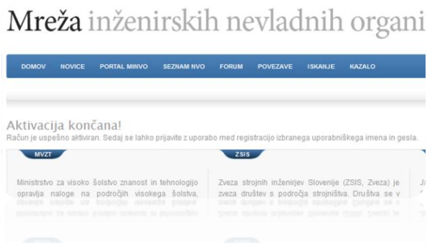
Slika 4: Aktivacija končana ter uspešno aktiviran uporabniški račun

Kot navedeno v prejetem e-poštnem sporočilu, kliknete in izberete priloženo povezavo ter dokončno aktivirate vaš uporabniški račun. Potrdilo o uspešni aktivaciji se vam izpiše v sklopu spletnega portala, kot prikazano na naslednji sliki 4: