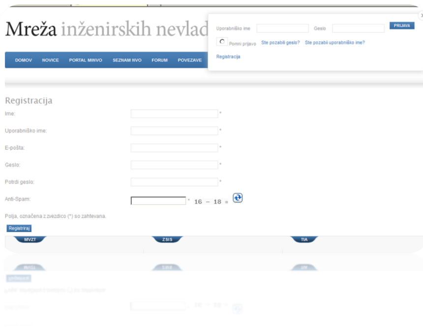
Slika 6: Registracija prikazana na večji formi

V novo odprtem oknu, kot prikazano na sliki 4 izberete gumb registracija (levo spodaj). Registracija se vam v tem primeru prikaže v večji obliki (slika 6), postopek pa je analogen prvotno opisanemu postopku registracije.